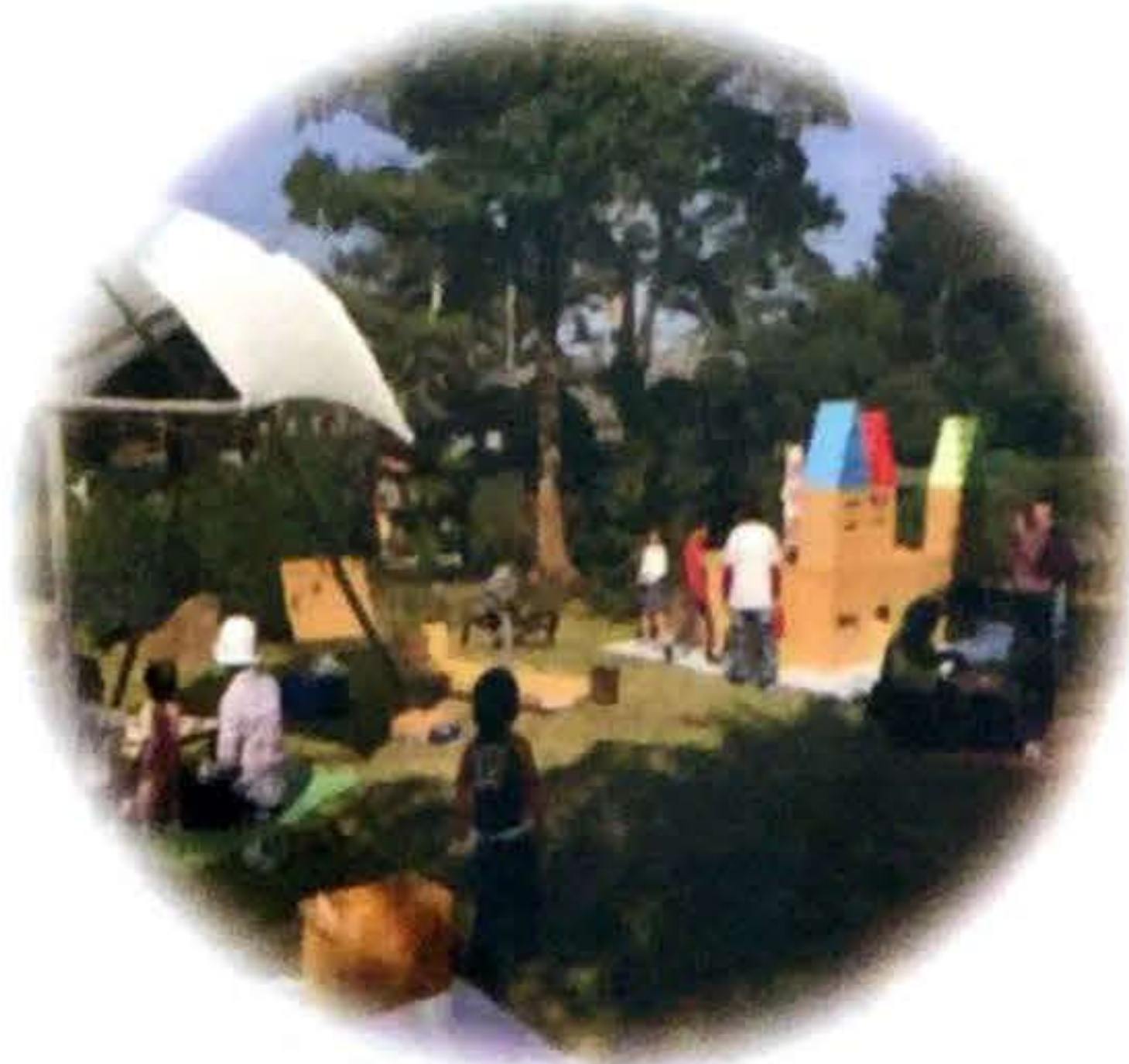
キッズパークの出店もあります! 工作したり、ターザンロープで遊んだり♪ 家族やお友達と遊びに来てね!