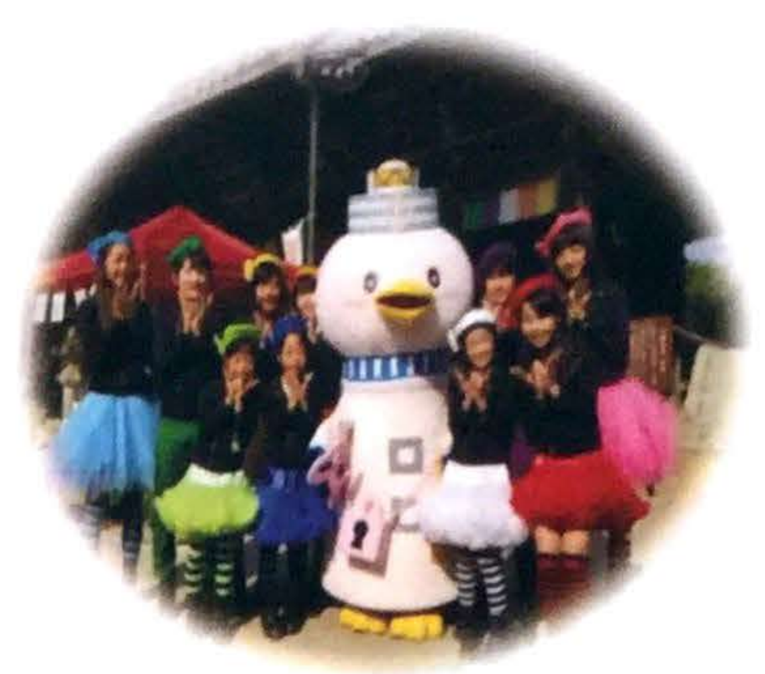
パフォーマンスもお楽しみに!