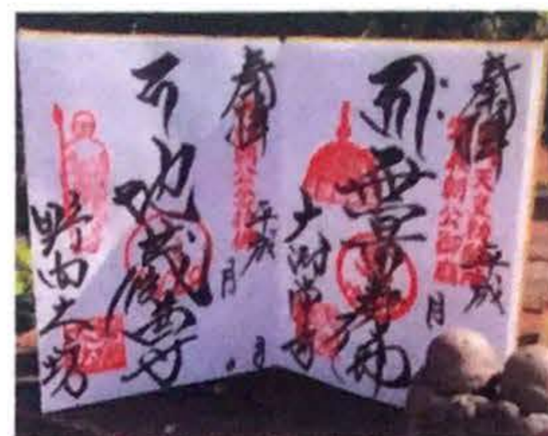
楽市の日には特別な御朱印を 授与させていただきます。