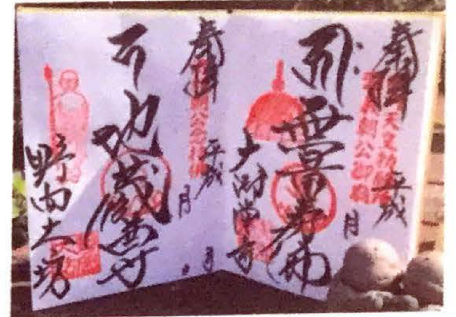
楽市の日には特別な御朱印を 授与させていただきます。