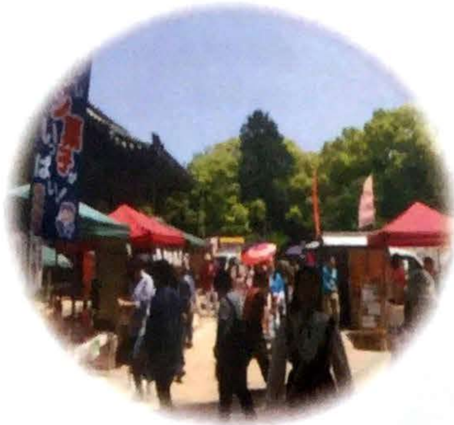
大坊の楽市の様子

毎月第一日曜日(8・9月はお休み。1月は第二日曜日)に野間大坊で楽市が開催されます。屋台・ワークショップ・手作り品のお店が多数出展します。また、当日はダンスや歌などのパフォーマンスが登場します。