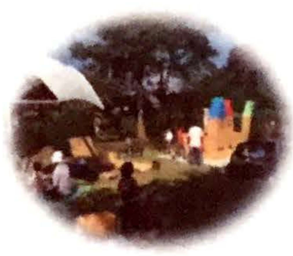
キッズパークの出店もあります! フルールドメールのみなさんの 工作したり、ターザンロープで遊んだり♪ パフォーマンスもお楽しみに! 家族やお友達と遊びに来てね!